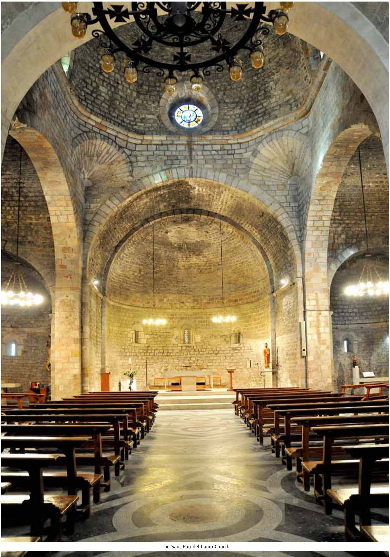
The Sant Pau del Camp Church