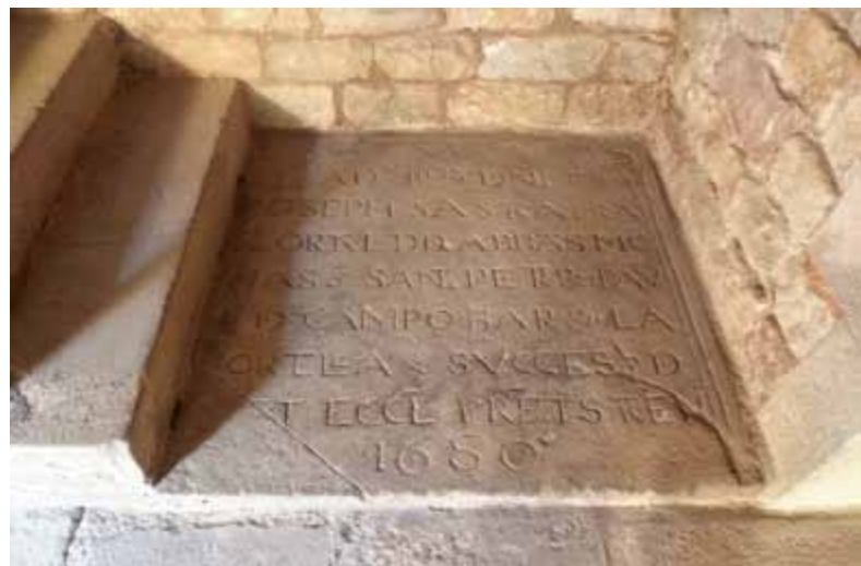
The abbot Josep Sastre's tombstone in a cloister corner