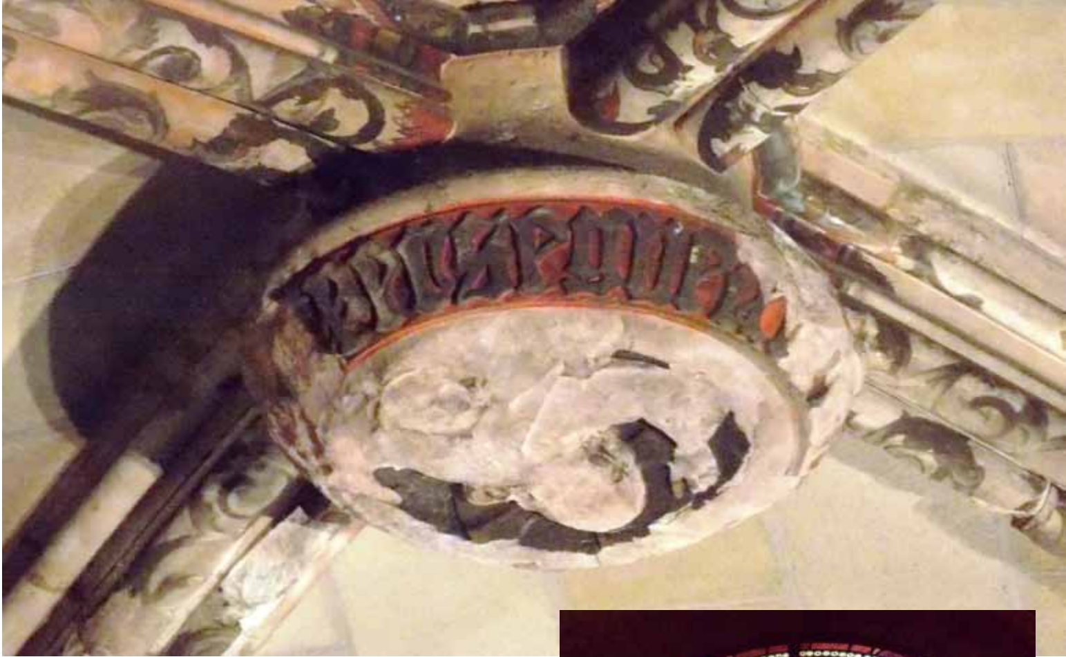
Ceiling detail still shows the remains of the fire in 1909

Sant Pau del Camp has witnessed key episodes in the history of Catalonia. Centuries later of Almanzor sacking the Catalan Government took refuge in the building when the siege of 1714. Should be noted that between 1680 and 1683 the Sant Pau abbot Josep Sastre i Prats was president of the Generalitat. His tombstone can still be seen in a corner of the cloister.