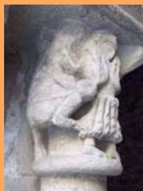
Above, eight of cloister column capitals. Below, a mysterious toad at foot of a column