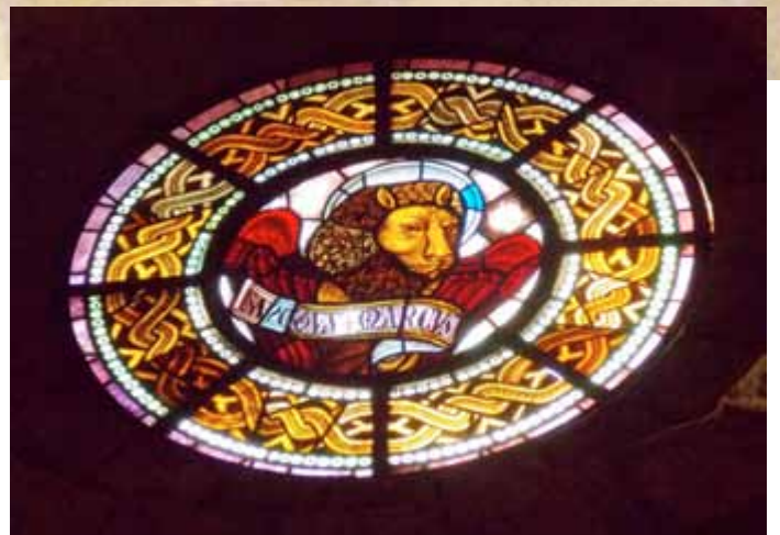
The lion of St. Mark in one of rosettes

In 1879 a group of Catalan intellectuals led a campaign to declare the church, the cloister and the chapter room national monument. Sant Pau was yet again burned in 1909 during the the Tragic Week, and in 1936.