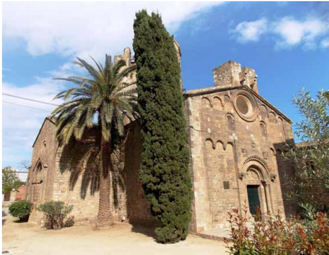
The Sant Pau del Camp church, in its garden surrounding.