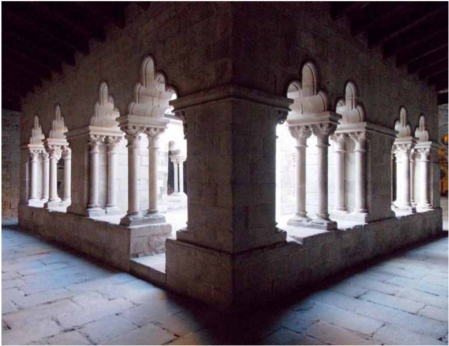
Cloister perspective in which the beauty of set of columns can be seen, an unique piece of Romanesque