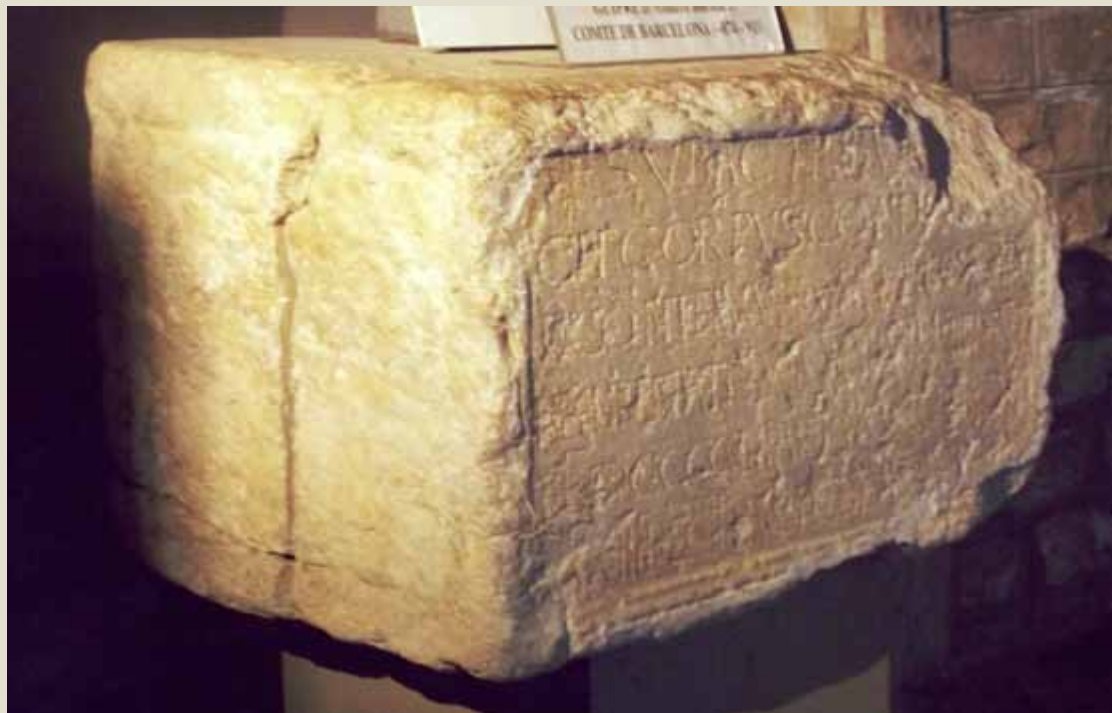
The tombstone of Guifré II, Count of Barcelona

Guifré II was the son of Guifré the Hairy, who legend says is in the quatre barres (the four red vertical stripes of Catalan flag) origin, when Charles II the Bald ran their fingers wet with the Earl's blood for his coat.